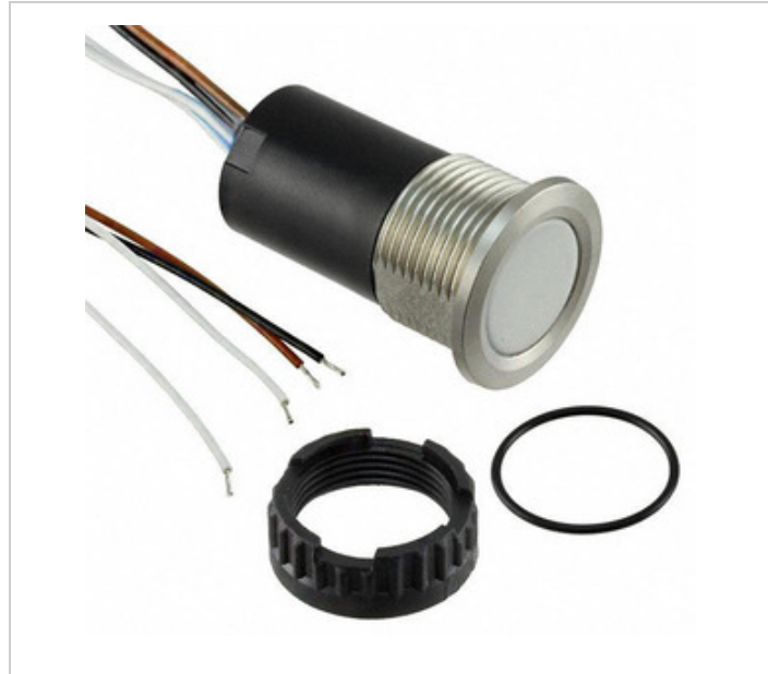
රූපය නිරූපණය විය හැකිය. නිෂ්පාදන විස්තර සඳහා පිරිවිතර බලන්න.